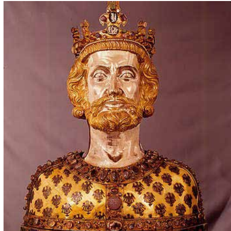
Borstbeeld Karel De Grote, uit de Domkerk te Aken